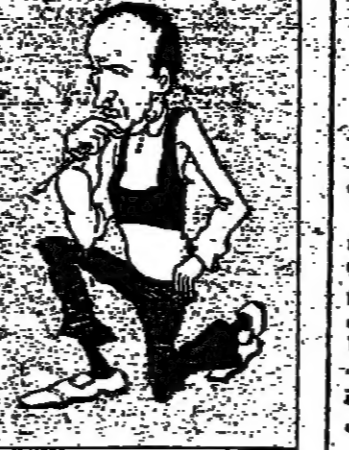
الرئيس الفرنسي ديستان

منذ انزل الرئيس الفرنسي فلفري جيسكار ديستان مهام الرئاسة، أعلن أنه من هدفه هو تغيير المجتمع الفرنسي بأكمله، ولا ثورة ولا اضطراب. وقد أخذت تفصيل هذا الهدف تحدت الآن، إذ أصدرت الحكومة سلسلة من القرارات الرامية إلى إحداث إصلاحات جوهرية في عدد من الحقول، مثل التعليم، ومركز الشركات، وحقوق العمال، والطلاق، والملكية الخفية. وقالت صحيفة «نيويورك تايمز» إن التحرك نحو التغيير خلق قلقا في بعض الأوساط السياسية، خاصة في فرنسا، حيث يرى البعض أن التغييرات التي يجريها ديستان تتجاوز حدود الإصلاحات المعتادة، وأنه يتقدم في اتجاهات خطيرة.